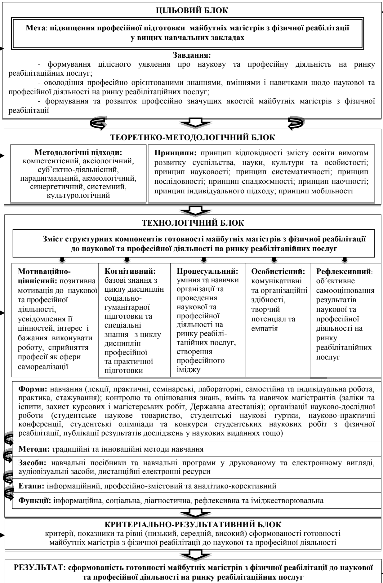
Рис. 1. Модель професійної підготовки майбутніх магістрів з фізичної реабілітації у вищих навчальних закладах

Педагогічні умови: трансформація змісту вищої освіти майбутніх магістрів з фізичної реабілітації з урахуванням особливостей наукової та професійної діяльності на ринку реабілітаційних послуг; формування ціннісного ставлення магістрантів до наукової та професійної діяльності у процесі впровадження інноваційних освітніх технологій; застосування сучасних інформаційно-комунікаційних технологій у навчально-виховному процесі; розвиток досвіду роботи у мультидисциплінарній команді в процесі проведення виробничих практик і науково-дослідної роботи магістрантів